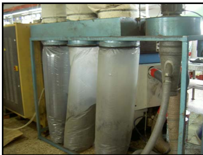
Foto de la máquina

Se recomienda que cada día esas virutas que se almacenan en sacos sean sacadas de la nave.